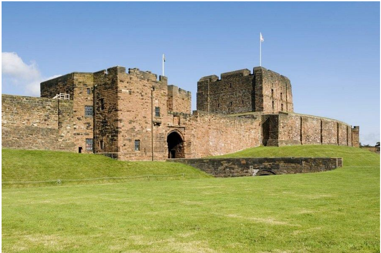
Carlisle Castle oggi